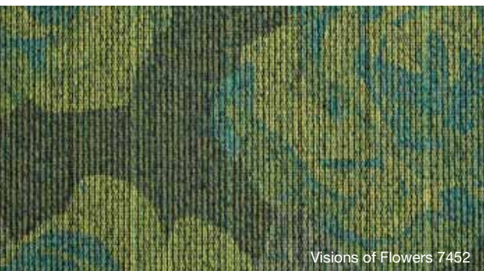
Visions of Flowers 7452